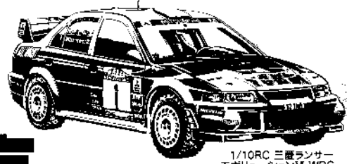
1/10RC 三菱ランサー エボリューションⅥ WRC