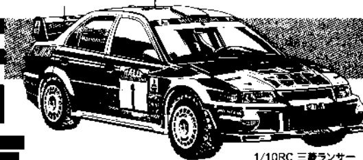
1/10RC 三軸ランサー エボリューションV WRC

主催=田宮模型 協力=ROX3 会場=浅草・ROX-3 屋内特設サーキット(路面:パンチカーペット)