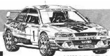
1/10RC スバルインプレッサ (199年ドイツ国内ラリー選手権優勝車)